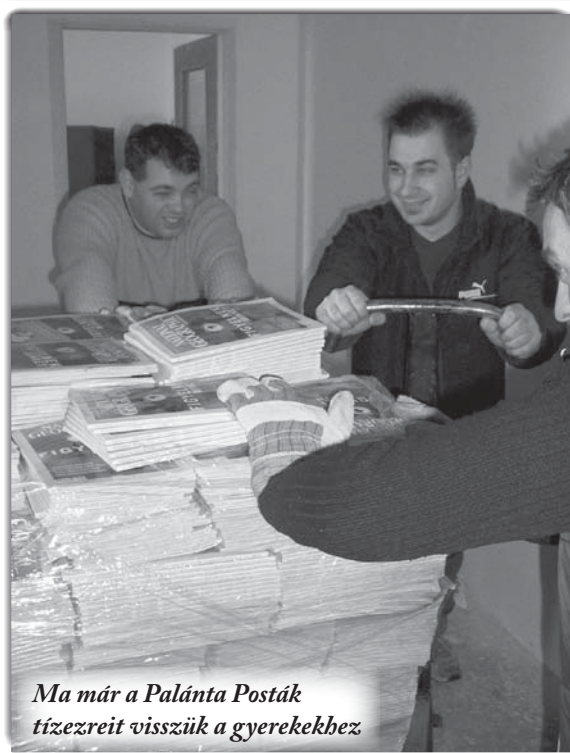
Ma már a Palánta Posták tízezreit visszük a gyerekekhez