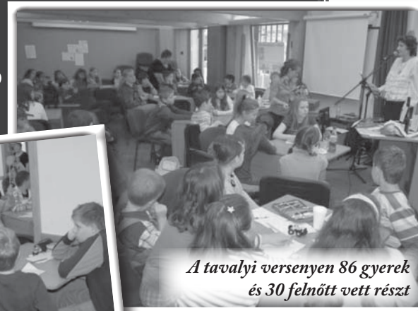
A tavalyi versenyen 86 gyerek és 30 felnőtt vett részt