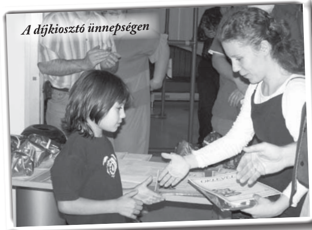
A díjkiosztó ünnepségen

1994-ben tartottuk első Evangéliumi Rajzpályázatunkat. A pályázat témái bibliai történetek voltak. 120 általános iskola kapott pályázati kiírást, és több mint 200 rajz érkezett be a versenyre. A bibliai történetek szövegét mellékeljük a kiíráskor, így megtörtént az a csoda, hogy a rajzórákon a