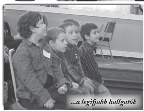
...a legifjabb hallgatók