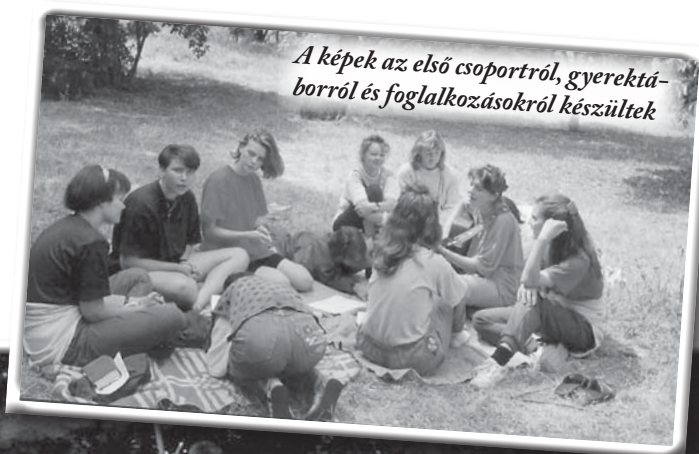
A képek az első csoportról, gyerektáborról és foglalkozásokról készültek