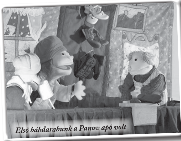
Első bábdarabunk a Panov apó volt

A Palánta-bábcsoport a pomázi bentlakásos gyermekintézményben is járt 1992-ben. Ez a nevelőotthon afféle gyűjtőhely volt, ahová az elárvult gyerekeket hozták. Rövid ideig maradtak itt, hogy aztán ismét szétosszák őket nevelőszülők és intézetek közt. Itt járt a Csemete Bábcsoport, és előadta a Panov apó című történetet. Az előadás közben egyszer