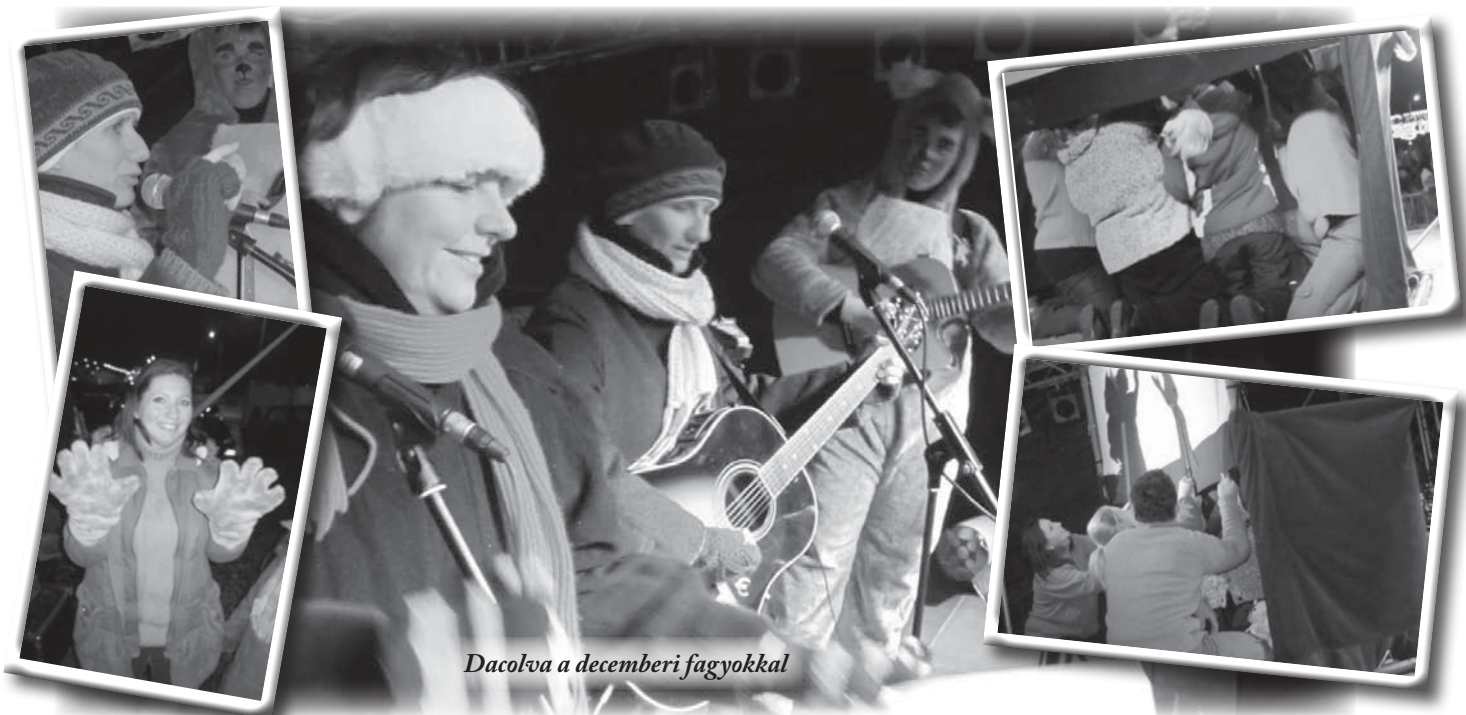
Dacolva a decemberi fagyokkal

A Palánta és a 4D Újdimenzió dicsőítő együttes az elmúlt karácsonyon sok kisgyermeknek és felnőttnek hirdette az evangéliumot a Vörösmarty téren, az Angyalok Erdejében és a Mikulásgyárban a Hősök terén, a Nagyothallók Intézetében, a Kőbányai Szabadidő Központban és a Civilházban, a VII. kerületben.