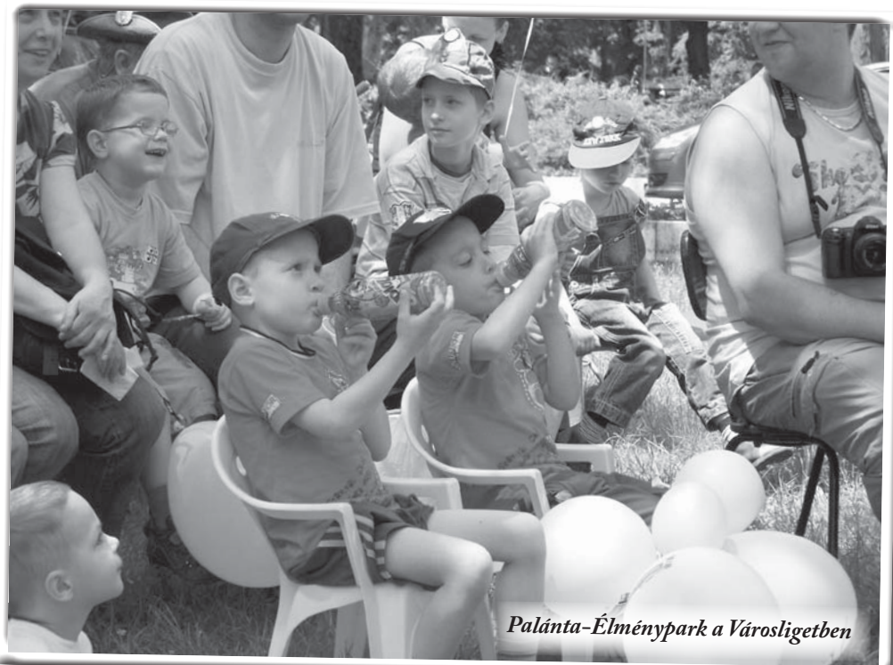
Palánta-Élménypark a Városligetben

Néhány szó, néhány kép talán közelebb hozza Önökhöz is ezt a szeretetben eltöltött születésnap ünnepet.