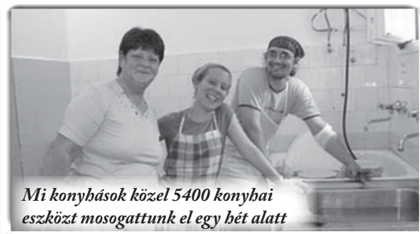
Mi konyhások közel 5400 konyhai eszközt mosogattunk el egy hét alatt

Mégis az Úr legcsodálatosabb ajándéka egy tinédzser lány megtérése volt. Éjjelente álmokban látta a jelenlegi helyzetét: elmondása szerint láncok voltak rajta, és nem tudott szabadulni. Egyik éjjel azonban elkezdte hangosan megvallani azokat az ígéket, amiket a táborban hallott, és a láncok lehulltak róla. A lány másnap elmondta a megtérők imáját! Másnap a szobatársa (az én tanítványom) hívott oda, hogy elmondja, mi történt, és mennyire megváltozott ez a lány: „azóta mindig mosolyog, és látszik rajta, hogy megnyugodott”. Az úton hazafelé pedig végig azt a János evangéliumát olvasta, amit a táborban kapott. Dicsőség az Úrnak!”