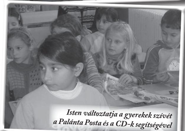
Isten változtatja a gyerekek szívét a Palánta Posta és a CD-k segítségével