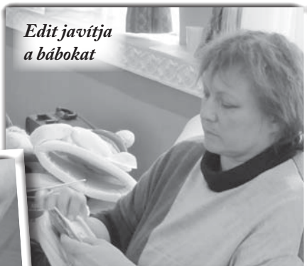
Edit javítja a bábokat