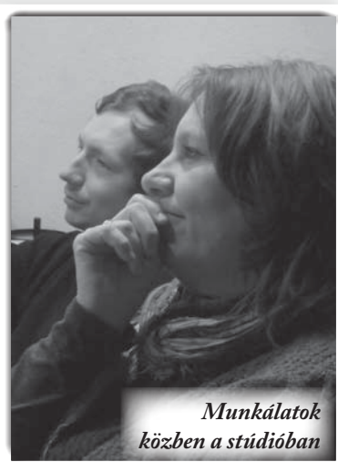
Munkálatok közben a stúdióban