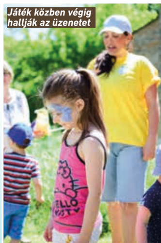
Játék közben végig hallják az üzenetet