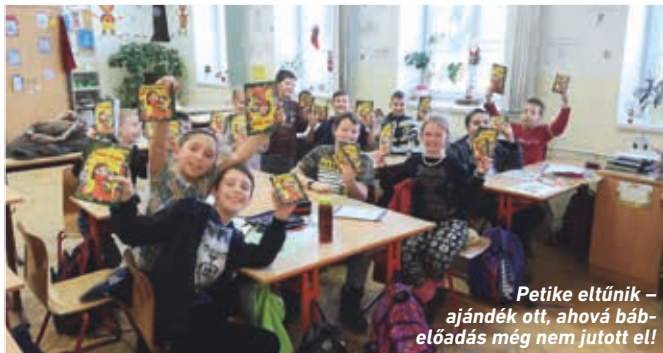
Petike eltűnik – ajándék ott, ahová bábdarab még nem jutott el!

Nagyon sok visszajelzést kaptunk, és sok mosolygós kisgyermek képét juttatták el az iskolák hozzánk. (Gyuricza Andrea)