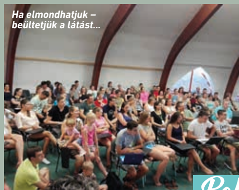
Ha elmondhatjuk - beültetjük a látást...