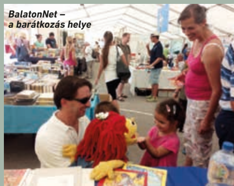
BalatonNet – a barátkozás helye