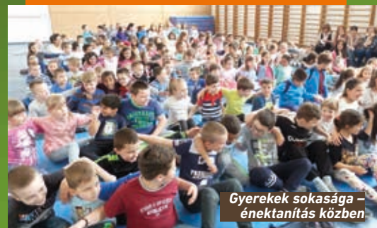
Gyerekek sokasága – énektanítás közben

„Az egyik óvónő megdicsért bennünket, hogy évről évre színvonalasabb a bábjátékunk. Mindenütt dicsérik a szép bábokat, háttereket, a jó játékunkat. Soli Deo Gloria!”