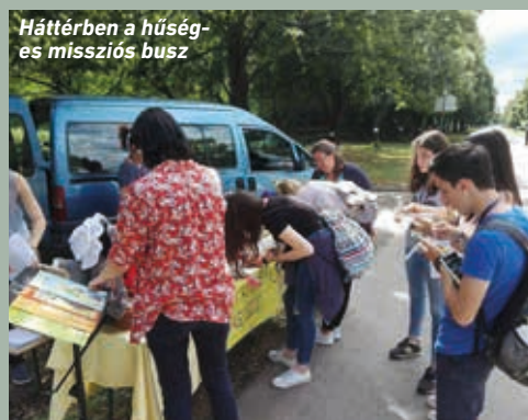
Háttérben a hűség- és missziós busz