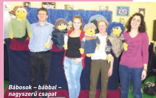
Bábosok – bábbal – nagyszerű csapat