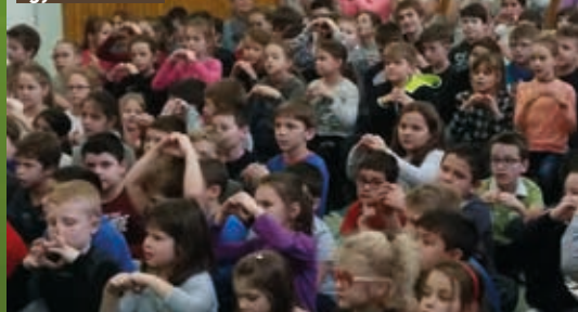
A legkisebbek figyelme