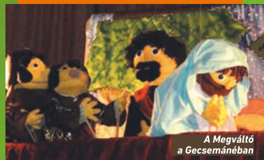
A Megváltó a Gecsemánében