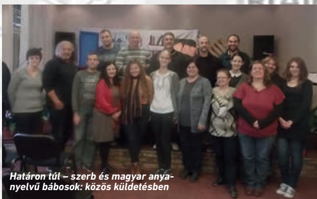
Határon túl – szerb és magyar anyanyelvű bábosok: közös küldetésben

Az egyik kislány szívből élvezte a munkát a „stúdióban”, rendkívül talpraesett volt, nagyon ügyesen igazgatta a dolgokat. Úgyhogy ez a rész is teljesen flottul ment. Így elkészült az ajándék CD is. (Lódrí Judit)