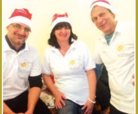
A csapat – barátok és harcostársak...