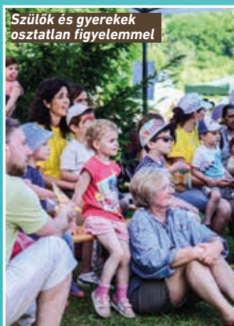
Szülők és gyerekek osztatlan figyelemmel