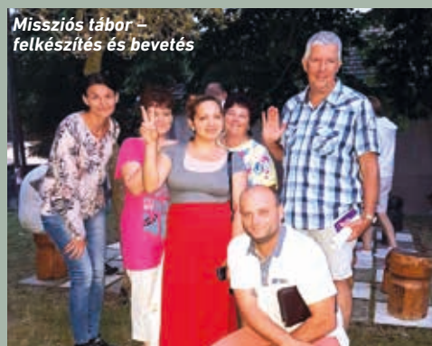
Missziós tábor - felkészítés és bevetés