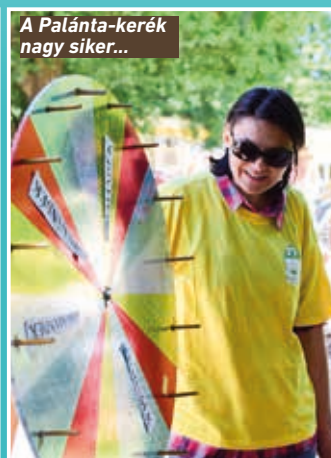
A Palánta-kerék nagy siker...

Ha az ideai budapesti palántás gyermeknapon szívesen segítenél nekünk önkéntesként, kérjük, jelezd a palantamisszio2016@gmail.com email címen! Sokféle segítségre lesz lehetőség, arcfestéstől az ügyességi játékok vezetésén át a fizikai erőt igénylő pakolási és szállítási munkáig.