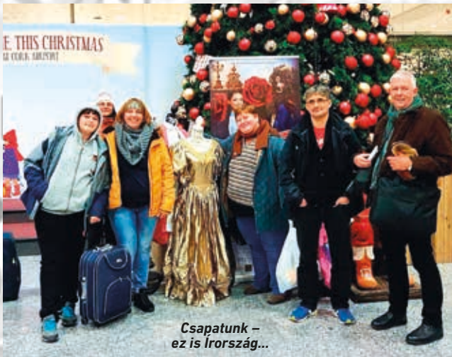
Csapatunk – ez is Írország...