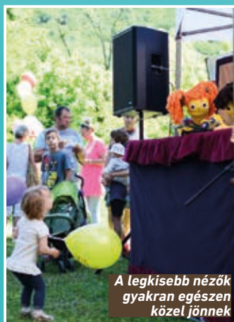
A legkisebb nézők gyakran egészen közel jönnek