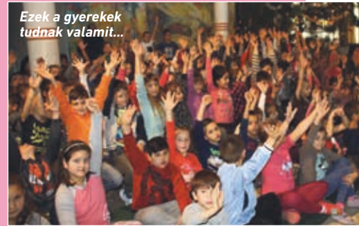
Ezek a gyerekek tudnak valamit...