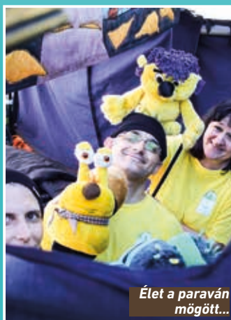
Élet a paraván mögött...

Mi ugyanúgy felkészültünk, a csapat ugyanolyan klassz volt, mint máskor, de valahogy minden úgy, olyan csodálatosan illeszkedett, olyan békeesség, olyan együttműködés, olyan öröm volt, hogy csak arra tudjuk visszavezetni, hogy az imádság hatott.