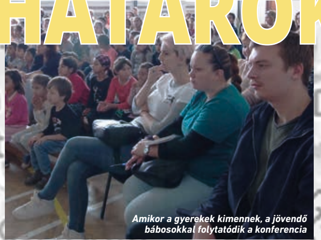
Amikor a gyerekek kimennek, a jövő bábosokkal folytatódik a konferencia

A kötetlen beszélgetések során sok-sok kérdés merült fel, érdekes történeteket osztottunk meg egymással. (ke)