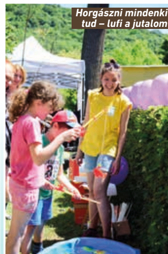
Horgászni mindenki tud – lufi a jutalom

2017 májusának utolsó vasárnapján már kora reggel szorgoskodtak a Palánta Misszió önkéntesei és munkatársai a Hűvösvölgyben, a Gyermekvasútnál. Sátrakat, paravánt, asztalokat állítottunk fel, kicsomagoltunk, lufit fújtunk (és még sok más dolgot is csináltunk) – felkészültünk a gyerekek és kísérőik fogadására.