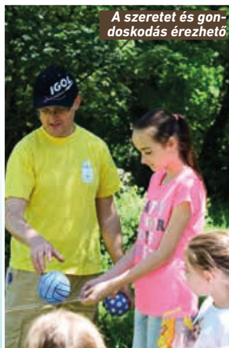
A szeretet és gondoskodás érezhető