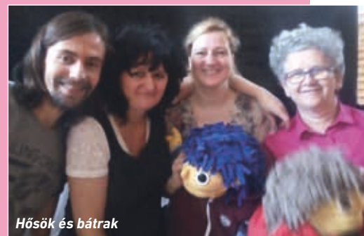
Hősök és bátrak

A 'Karácsonyi kincskeresők'-et báboztunk egy olyan helyszínen, ahol viszonylag sötét volt a terem. Felkapcsoltuk a bábok fejlámpáját a barlang-jelenetnél. A gyereket teljesen lenyűgözte, amikor a fiúk elővették a „kincset”: „Hú, féldrágakő!”, és csillogott, ahogy a lámpával rávilágítottam. Utána kinyitottuk a kincses ládát, ott világított a „kincs”, ez teljesen magával ragadta őket. De már maga a barlang háttér, ahogy „sejtelmesre lámpáztuk”, ámulatba ejtette a gyereket. Hatalmas élmény volt, hogy annyira rácsodálkoztak, mintha valami csodát vittünk volna oda.