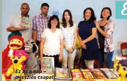
Ez az a nap - missziós csapat