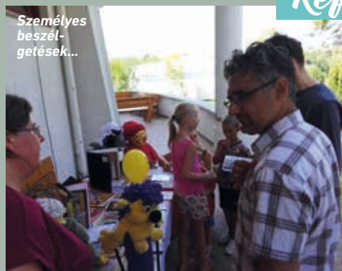
Személyes beszél- getések...