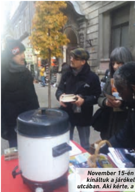
November 15-én délután angol teával kínáltuk a járókelőket a Bethlen Gábor utcában. Aki kérte, a tea mellé imát is kapott.