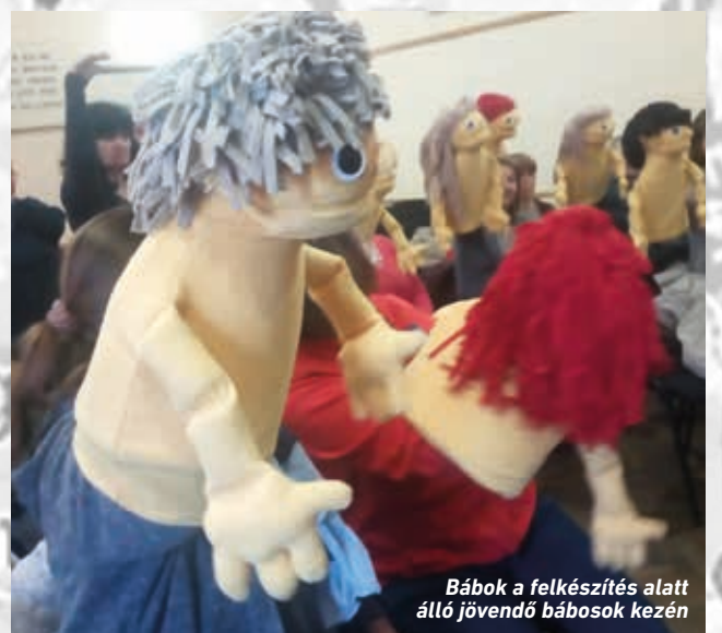
Bábok a felkészítés alatt álló jövő bábosok kezén