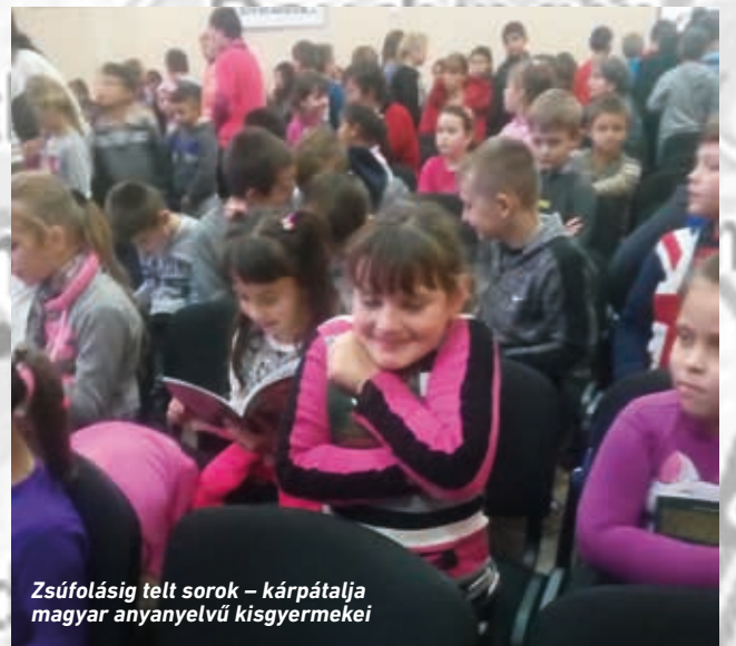
Zsúfolásig telt sorok – kárpátaljai magyar anyanyelvű kisgyermekei

Az odafelé utunkról röviden szeretném elmondani, hogy 2 kisbusszal indultunk bábfelszerelésekkel, ajándék CD-kkel, foglalkoztató füzetekkel megpakolva. Vásárosnamény előtt az egyik kisbusz kuplungja teljesen elromlott, de nem estünk kétségbe, Istennek hálát adtunk ezért a helyzetért is, s kértük, vártuk a szabadítást. S a csoda megtörtént: az elől járó kisbusz visszajött értünk, elvontatott egy műhelyhez, ahol gyorsan és nem túl drágán megjavították. Isten jó és szabadító Isten. Nem hiúsult meg az utunk. Bár egy kicsit késtünk, de a bábfelszerelést át tudtuk adni, az ajándékok is célba értek, s a határon sem volt fennakadás. Hazafelé ugyan újra elromlott a busz Pest közelében, késő éjjel, ráadásul az autópályán, de hála Istennek, adott az Úr éber figyelmet a buszt vezetőknél, a vontatásban segítőknek a kimerítő vezetés végén is, s mindenki hazajutott épségben, elvégezve a ránk bízott munkát, szolgálatot! Dicsőség az Úrnak! (Mihácz Zita)