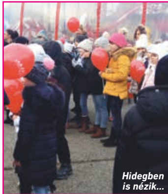
Hidegben is nézik...