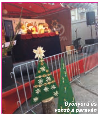
Gyönyörű és vohzó a paraván