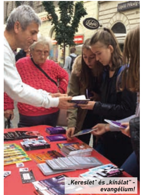
„Kereslet” és „kínálat” - evangélium!