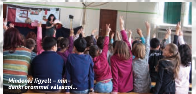
Mindenki figyelt – mindenki örömmel válaszol...

KÁRPÁTALJA – 2017. november 16-án indultunk Nagyberregbe, egy kárpátaljai település iskolájába. Bábkonferenciát tartottunk a szép számmal összegyűlt érdeklődőnek, akik zömében pedagógusokból és hitoktatókból álltak.