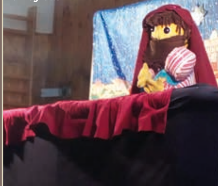
Megszületett a Megváltó