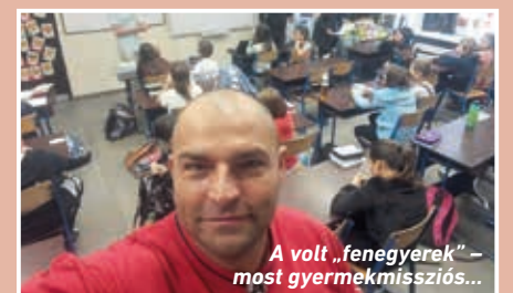
A volt „fenegyerek” – most gyermekmissziós...