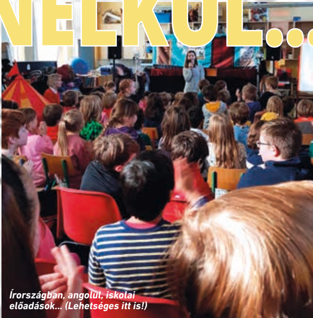
Írországban, angolul, iskolai előadások... (Lehetséges itt is!)

ÍRORSZÁGBA november végén mentünk, előre kiküldtünk egy szett Panov apó felszerelést meg egy Sünikét. 7 muppet báb van a Panov apóban, egy kislány van a Sünikében, a rókának és a farkasnak mozgatható a szája, de Sünikével nem lehet a szájmozgatást tanulni. Szombat délután jött el az a programpont, hogy a bábmozgatást betanuljuk. Elkezdtek kiosztani a bábokat, és mennyien voltak, akik be akartak tanulni? Pont annyian, hogy mindenkinek jutott a kezére báb. Kinek nem maradt báb a kezére? Természetesen nekem.