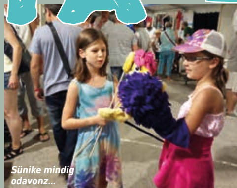
Sünike mindig odavonz...