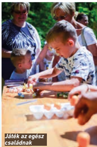
Játék az egész családnak