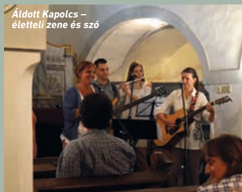
Áldott Kapolcs - élettel zene és szó