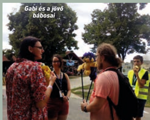
Gabi és a jövő bábosai