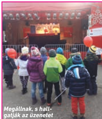
Megállnak, s hallgatják az üzenetet