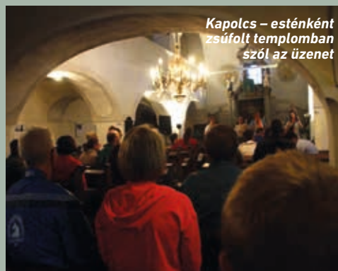
Kapolcs - esténként zsúfolt templomban szól az üzenet