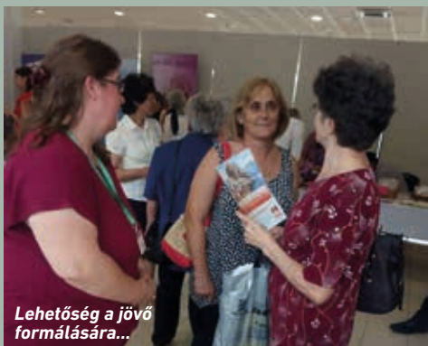
Lehetőség a jövő formálására...