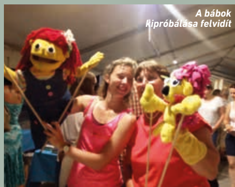
A bábok kipróbálása felvidít