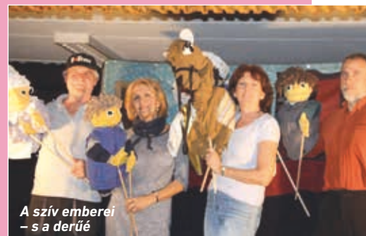
A szív emberei – s a derű

A 'Karácsonyi kincskeresők'-et báboztunk egy olyan helyszínen, ahol viszonylag sötét volt a terem. Felkapcsoltuk a bábok fejlámpáját a barlang-jelenetnél. A gyereket teljesen lenyűgözte, amikor a fiúk elővették a „kincset”: „Hú, féldrágakő!”, és csillogott, ahogy a lámpával rávilágítottam. Utána kinyitottuk a kincses ládát, ott világított a „kincs”, ez teljesen magával ragadta őket. De már maga a barlang háttér, ahogy „sejtelmesre lámpáztuk”, ámulatba ejtette a gyereket. Hatalmas élmény volt, hogy annyira rácsodálkoztak, mintha valami csodát vittünk volna oda.