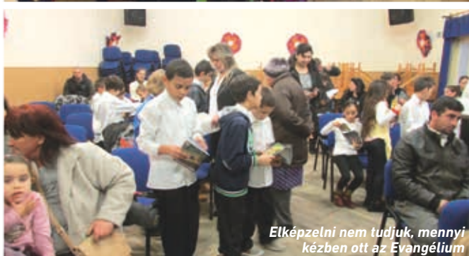
Elképzelni nem tudjuk, mennyi kézben ott az Evangélium