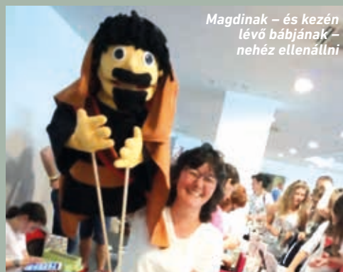
Magdinak - és kezén lévő bábjának - nehéz ellenállni