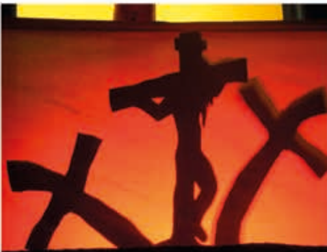
Az árnyjelenetekhez színes reflektorokat használunk, így még nagyobb hangsúlyt kap az evangélium üzenete.