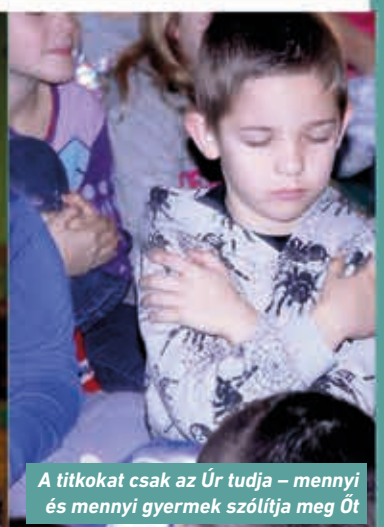
A titkokat csak az Úr tudja – mennyi és mennyi gyermek szólítja meg Őt