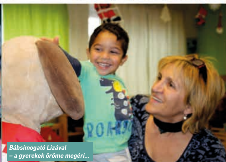
Bábsimogató Lizával – a gyerekek öröme megéri...