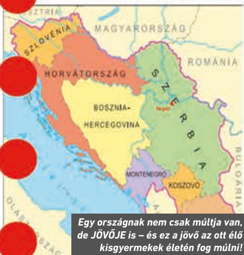
Egy országnak nem csak múltja van, de JÖVŐJE is – és ez a jövő az ott élő kisgyermek életén fog múlni!