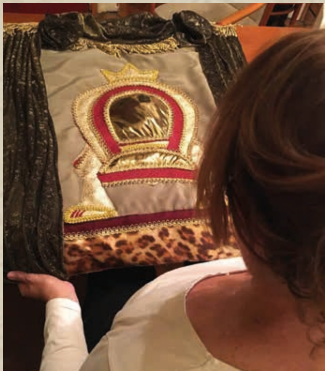
Ahogy egy királyi trón elnyeri végső formáját és pompáját – bábhátteren

Ki gondoskodik a vizuális megjelenítésről? Például hogyan készülnek az új hátterek?