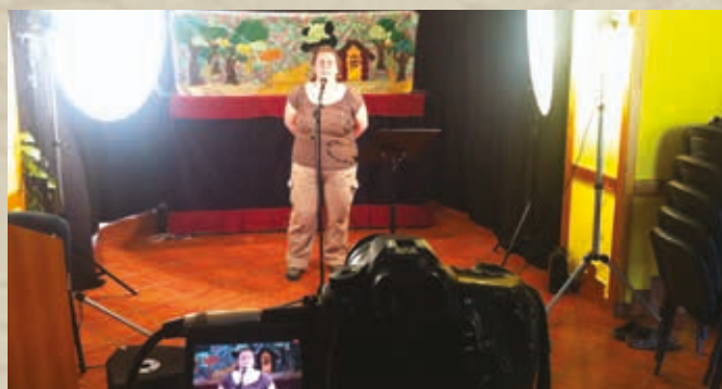
Istentiszteleti helyiség átalakítva videó-stúdióvá: oktató DVD készül

Sok testvér összefogása és odaszánása kell, amíg az előadásokig eljutunk. Felkérem az amatőr hangszínészeket (akik bár amatőrök, sokszor profi szinten tudnak már színészkedni), hogy jöjjenek be a stúdióba, és játsszák el a szerepeket. Ők a Palánta munkatársi, baráti köréből kerülnek ki, illetve olyan önkéntesek, akik kifejezetten ezzel segítenek nekünk.