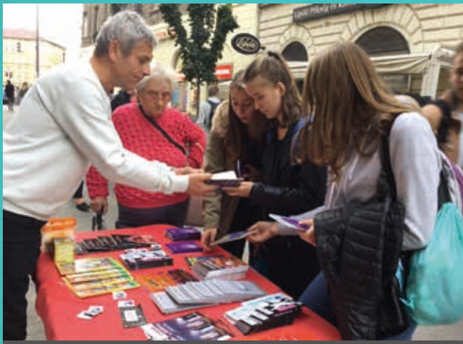
Tíbi akcióban... az ajándékok az utcán meglepetést szereznek és örömet

Hamar kiderül, hogy az ország egy távoli szegletéből, Záhonyból érkezett Budapestre. És egyszer csak megkérdezi, hogy nem mi vagyunk-e azok, akiktől a „hangyás mese”(!!!!) való? Mit mondjak? Beletelt egy kis időbe, amire rájöttem, hogy a „Tavaszi kirándulás”-ról van szó... A fiatalember pedig elmondta, hogy mennyire szerette ezt a mesét, milyen sokszor meghallgatta. És nem is tudhatta, hogy miközben ő újra és újra hallgatta a kedves történetet, az Ige magjai el lettek vetve a szívében, és egy napon – Isten pontosan tudja, melyiken – ezek a magok ki fognak kelni, és termést is fognak hozni. Dicsőség az Úrnak!