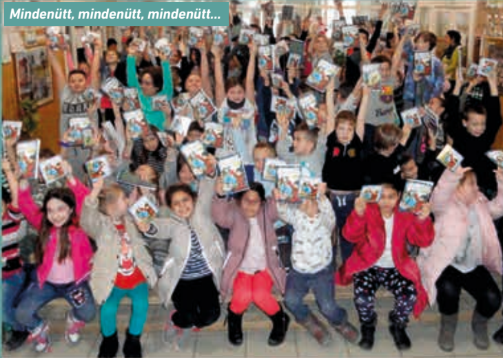
Mindenütt, mindenütt, mindenütt...