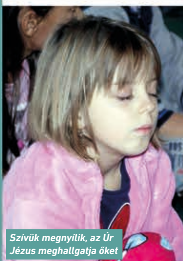
Szívkük megnyílik, az Úr Jézus meghallgatja őket