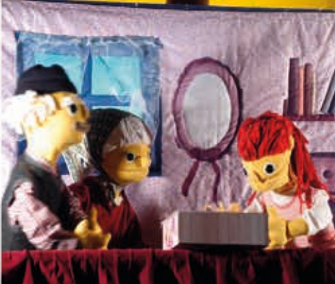
Egy álomban a mesék szereplői egyszerre is feltűnhetnek...