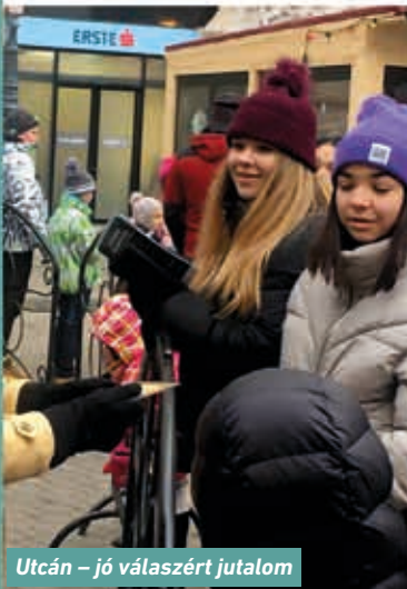
Utcán – jó válaszáért jutalom