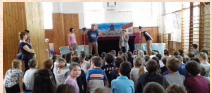
Tornaterem – bábozással: öröm és üzenet gyermeknek és felnőttnek

Eléri az utca emberét és a szülőket is. A játszótéri bábozások (!) útján, a gyermeknap és egyéb fesztiválok, gyermektáborok, falunapok és művelődési házak előadásain is megszólítja a családokat, a szülőket és a nagyszülőket. Itt is közvetlen kapcsolatot teremt a gyermekekkel és azzal a közeggel, ami őket körülveszi.