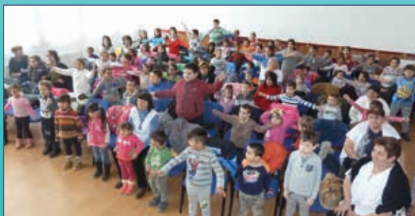
A dal is üzenetet hordoz – a gyerekek örömmel tanulják

Látni azt a szeretet és tudásvágyat, ami a gyerekmosolyok mögött van, számomra azt az érzést adja, mintha már a mennyben lennénk! Remélem, minél több gyerekarcot látunk majd viszont az Úr házában!