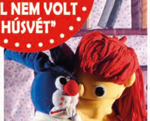
Ne félj, a húsvét NEM a „húsvéti nyusztól” függ!