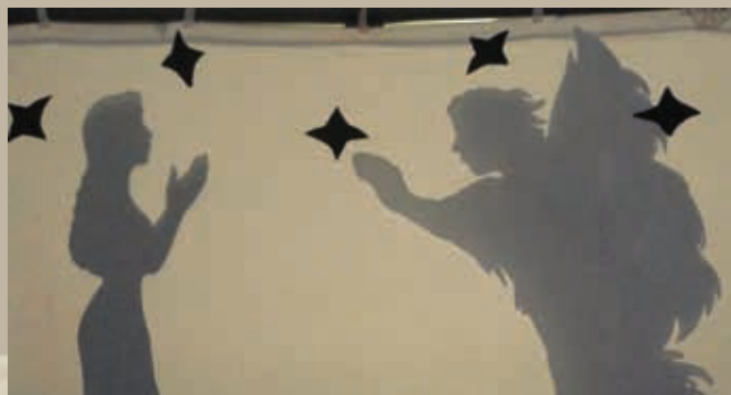
Az árnyjelenetek állóképek – s közben az Ige szól végig. Az állóképek alatt a figyelem 100%-os – az Ige behull a szívekbe

Amikor ez az itteni bábcsoport megtanulta a darabot, ők hogyan tanítják meg a többi bábcsoportoknak?