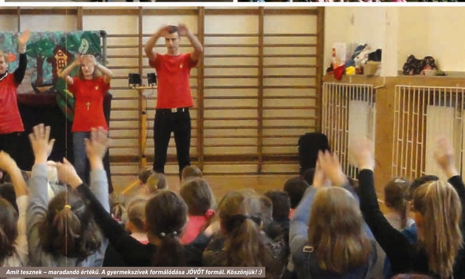
Amit tesznek – maradandó értékű. A gyermekszívek formálódása JÖVŐT formál. Köszönjük! :)