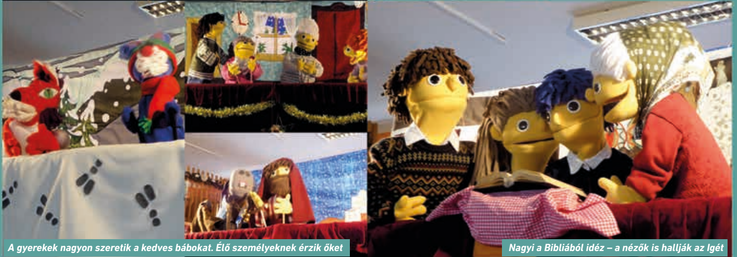
A gyerekek nagyon szeretik a kedves bábokat. Élő személyeknek érzik őket