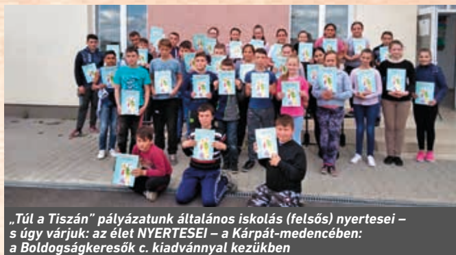
„Túl a Tiszán” pályázatunk általános iskolás (felsős) nyertesei – s úgy várjuk: az élet NYERTESEI – a Kárpát-medencében: a Boldogságkeresők c. kiadvánnyal kezükben

Ezekben a helyzetekben a deviancia, a drog, a korai, felelőtlen szexualitás, nagyon gyorsan megtalálja őket