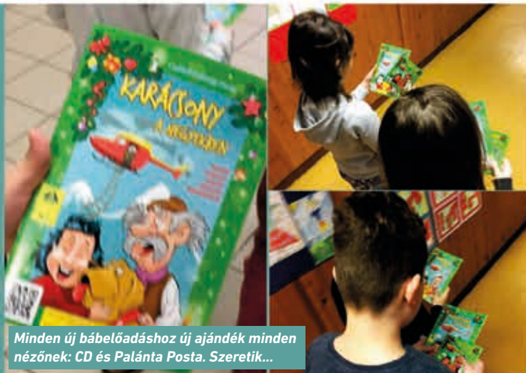
Minden új bábelőadáshoz új ajándék minden nézőnek: CD és Palánta Posta. Szeretik...