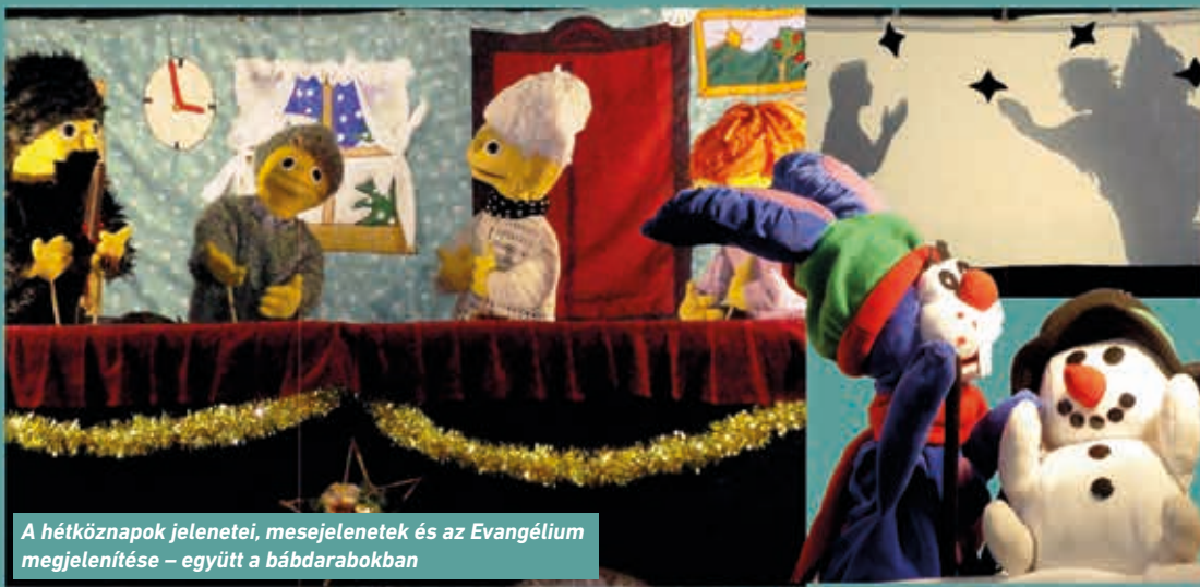
A hétköznapi jelenetek, mesejelenetek és az Evangélium megjelenítése – együtt a bábdarabokban