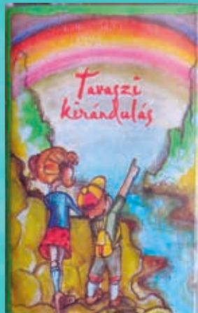
A kazetta akkori borítója

Valahogy az idő múlásával a kazetta feledésbe merült. Néha-néha eszembe jutott, de sosem vettem a fáradságot, hogy megkeressem, miután egyszer nem találtam. Azóta 21 éves lettem és elég sok mindenen keresztülmentem. Majd egy testvéri veszekedés után, pár hónappal ezelőtt a családommal felidézünk a régen hallott történetekből és úgy döntöttünk, megkeressük az interneten a Tavaszi Kirándulást. Meg is találtuk. Azóta minden este azt hallgatom. Megnyugtató érzés minden este újra és újra meghallgatni és újabb dolgokat felfedezni a történetekben, olyanokat, amiket gyerekkoromban nem vettem észre.”