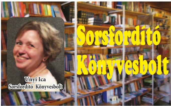
Unyi Ica Sorsfordító Könyvesbolt

A Sorsfordító Könyvesbolt nagyon alkalmas arra, hogy az ember megtalálja azt, amire a leginkább szüksége van a lelke, vagy a szelleme számára. Találhatók különböző bibliafordítások, kommentárok, bibliai segédkönyvek, hitmélyítő és hiterősítő könyvek, kapcsolatok helyreállítására való irodalom, gyermeknevelés, oktatás, de sok-sok gyermek és ifjúsági könyv is. Tehát az egész család számára van választék bőségesen, amire csak szükség lehet. És akkor nem is szóltam még a Palánta Gyermek- és Ifjúsági Misszió kiadványairól, CD-iről, a hozzájuk tartozó interaktív füzetekről, mese- és zenekazettákról, tanítványozó sorozatokról, mindenféle egyéb tárgyokról. Sokan szeretnek ajándékozni. Itt nálunk meg lehet találni a legmegfelelőbbet kedves rokonaik, barátai, ismerőseik számára.